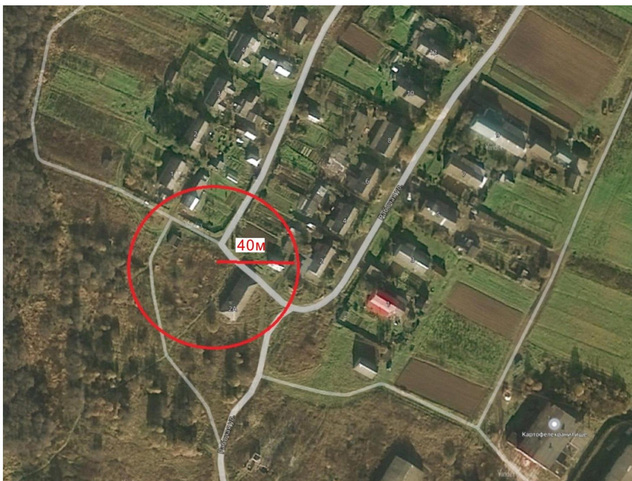
Схема границы прилегающей территории к государственному учреждению здравоохранения Ярославской области «Рыбинская ЦРП» Покровский ФАП (Рыбинский район, Покровское СП, с. Покров, ул. Рабочая, д.2 б)

Начальник управления АПК, архитектуры и земельных отношений администрации Рыбинского МР